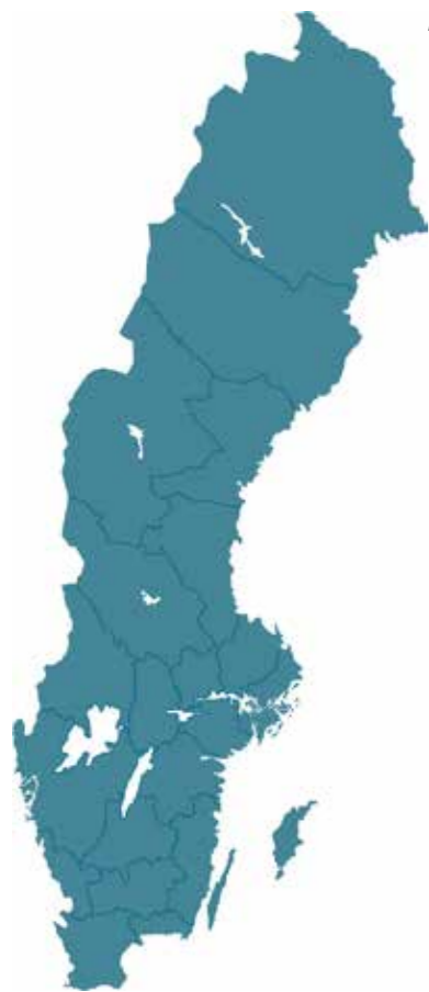
Nu har alla regioner samma uppdrag

De förtroendevalda ska kunna basera besluten på sin kunskap och överblick av de lokala och regionala förhållandena och på breda och kontinuerliga kontakter med medborgarna och berörda intressenter. Detta är grunden för den starka kommunala självstyrelsen på lokal och regional nivå i Sverige.