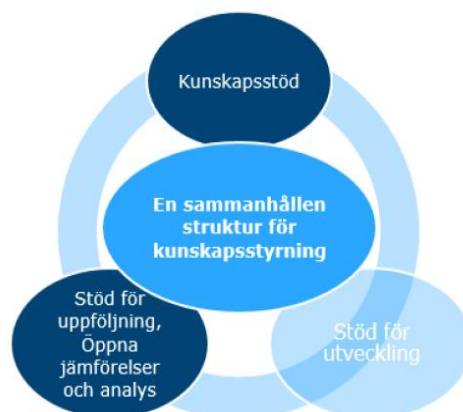
Figur 1. En sammanhållen struktur för kunskapsstyrning.

Vägledande för det som görs nationellt gemensamt är att det sker inom områden där samverkan är mer ändamålsenligt och effektivt än att varje landsting gör arbetet var för sig och att det kompletterar och stödjer det som behöver göras på regional och lokal nivå. Samverkan sker i första hand kring de två delkomponenterna kunskapsstöd och stöd till uppföljning, öppna jämförelser och analys . Andra viktiga delkomponenter för en effektiv kunskapsstyrning är stöd till utveckling och stöd till ledarskapet , vilket det bäst ges förutsättningar för lokalt.